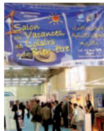
1 er Salon des Vacances, des Loisirs et du Bien-être