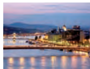
Budapest et son thermalisme