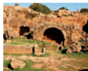
Patrimoine romain de Tipaza